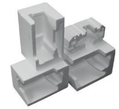
EPS 6, AIRPOP, STYROPOR®