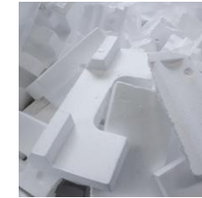
EPS Verpakking of Productieafval