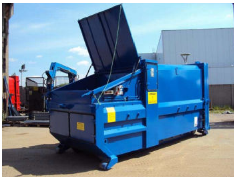
Perscontainer met deksel op invulopening

PR P type mobiele Perscontainer is special ontworpen voor het verdichten van grote volume karton, plastic, restafval of grote hoeveelheden huisvuil. De grote invulopening van 1000 mm lengte is geschikt om stukken karton en/of restafval te verdichten. De PR P wordt gebruikt bij distributie centra en logistieke bedrijven waar grote stukken afval samenkomen. De perscontainer kan worden gevuld met de hand of een heftruck en een kantelsysteem voor rolcontainer.