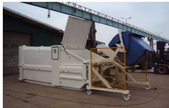
Perscontainer met kantelsysteem